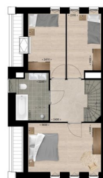
Eerste verdieping | Afgebeeld bouwnummer 2 Bouwnummer 4 is geprojecteerd inwoners: 1-2