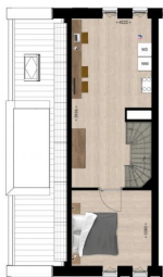
Tweede verdieping | Afgebeeld bouwnummer 2 Bouwnummer 4 is geprojecteerd inwoners: 1-2