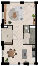
Begane grond | Afgebeeld bouwnummer 2 inwoners: 1-2